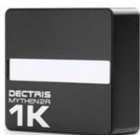
Модель 2R 1K

Количество каналов: 1280 Активная область: 8 x 64 мм 2