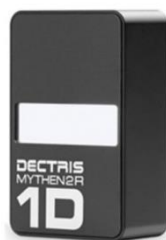
Модель 2R 1D

Количество каналов: 640 Активная область: 8 x 32 мм 2